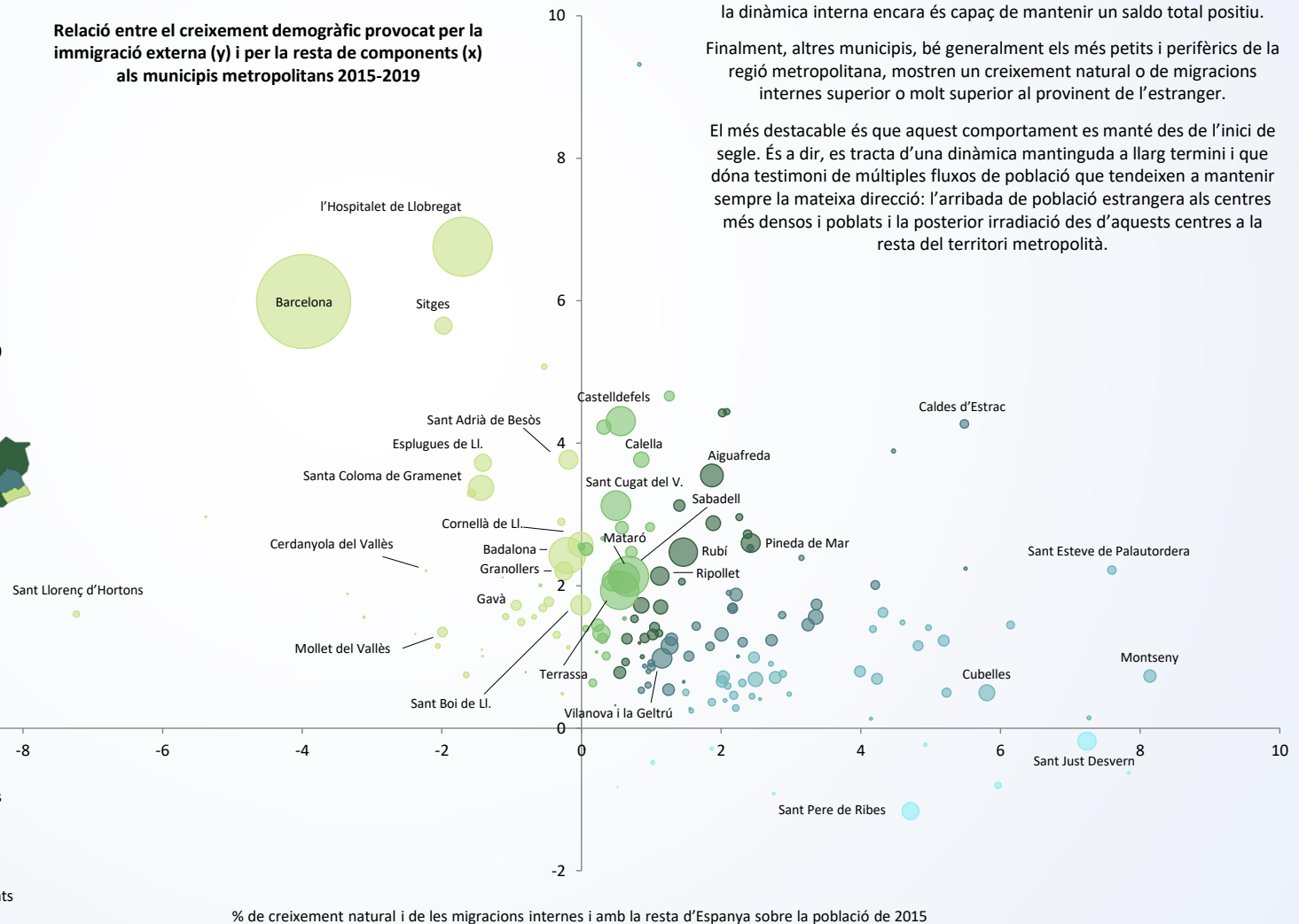
Principal dinàmica demogràfica dels municipis metropolitans 2015-2019